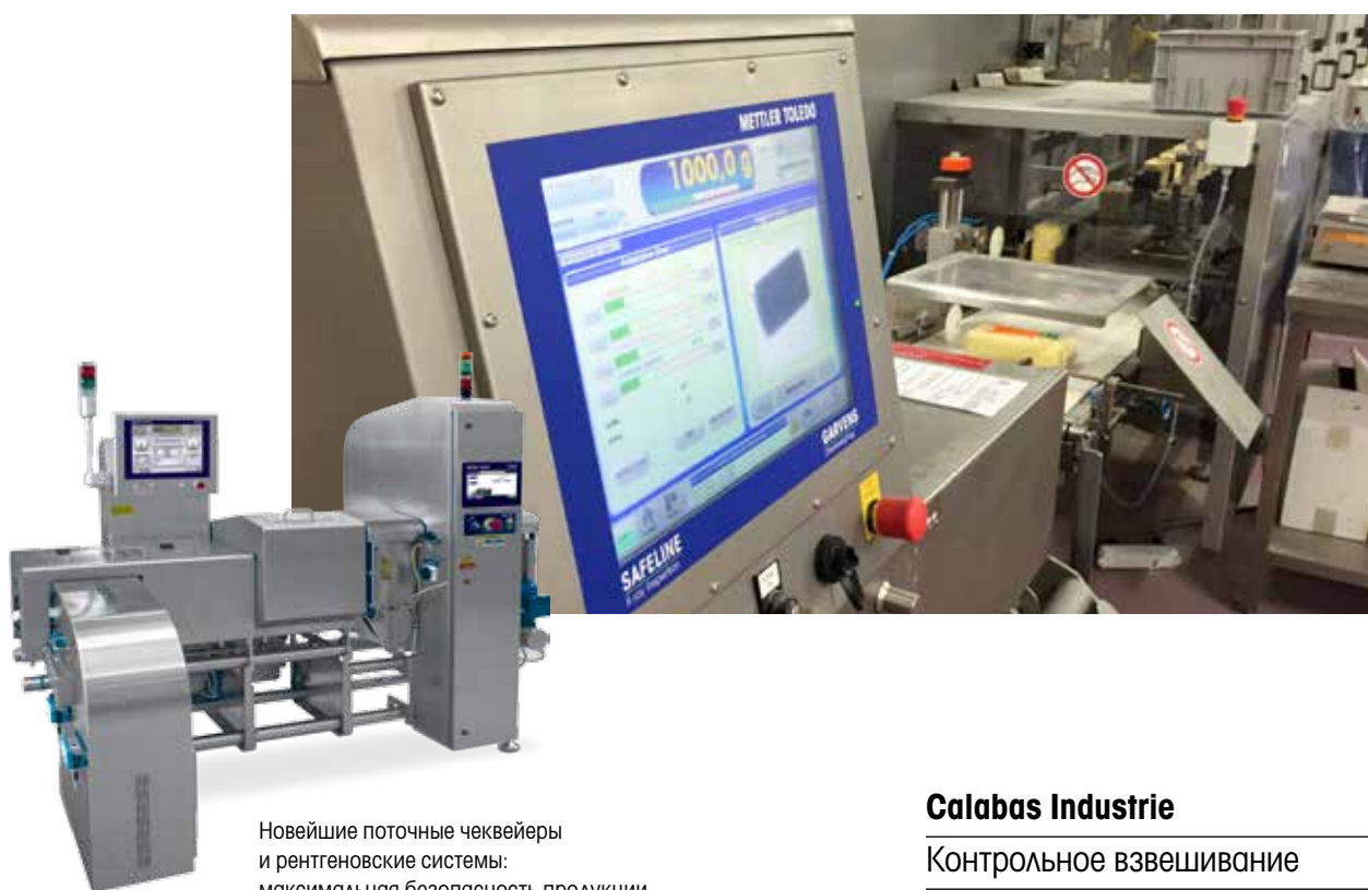
Новейшие поточные чеквейеры и рентгеновские системы: максимальная безопасность продукции

Французская компания Calabas Industrie, основанная в 2010 году, специализируется на логистическом и складском обслуживании предприятий пищевой промышленности и выполняет большой объем заказов на фасовку сушеных фруктов и овощей. Компания давно заслужила доверие крупных заказчиков. Она не просто обещает качество, а действительно