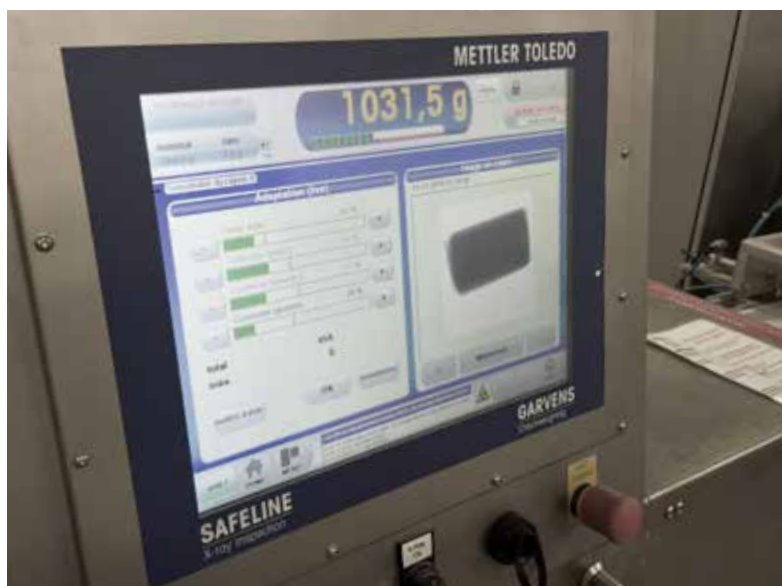
В комбинированной системе пользовательский интерфейс управляющей программы отображает результаты и весового, и рентгеновского контроля

Применение чеквейеров автоматически гарантирует соответствие фасовки европейским стандартам. Аналогично упаковкам, содержащим инородные включения, упаковки с недостаточным весом немедленно отбраковываются. На производственных линиях фасуются разнообразные продукты. Удобный интерфейс и большая память для хранения настроек продукта — лишь некоторые из особенностей программного обеспечения, установленного на контрольном оборудовании. Благодаря этим и другим полезным функциям сокращаются трудозатраты оператора и растет коэффициент общей эффективно-