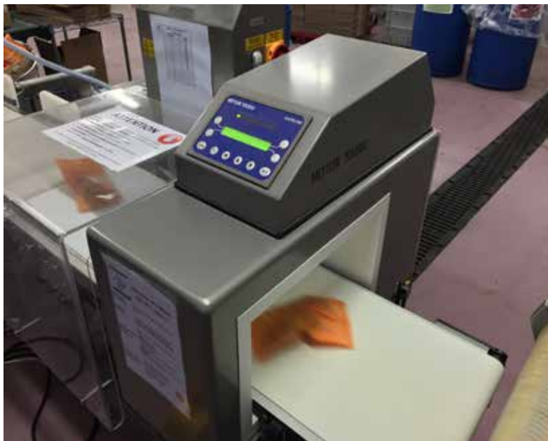
В критических контрольных точках (КТК) всех производственных линий все упаковки проверяются на наличие металлических включений согласно требованиям стандартов IFS по безопасности пищевой продукции

обеспечивает чистоту и безопасность как процессов, так и готовой продукции. Заказчики и потребители могут быть уверены, что упаковки не содержат инородных включений, а их вес точно соответствует европейским стандартам фасовки.